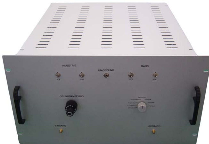
Abb. 2: Kanalemulator im 19-Zoll-Gehäuse